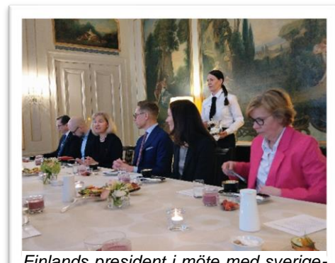
Finlands president i möte med sverigefinländska organisationer.