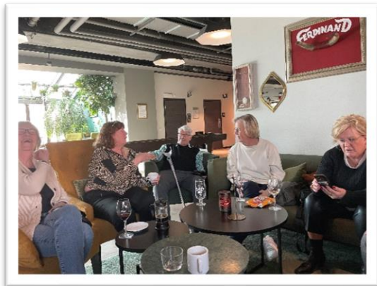
Mingel i lobbyn.

Helgen den 20–21 april hölls Fris årsmöteshelg på Quality Hotel Winn i Haninge.