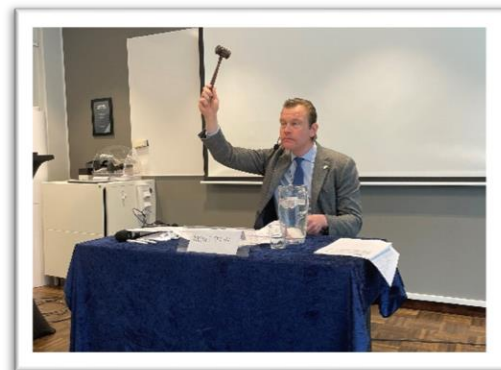
Mötesordförande Markus Selin.